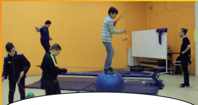
FÊTE DU PRINTEMPS