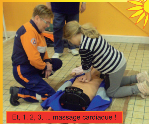
Et, 1, 2, 3, ... massage cardiaque !