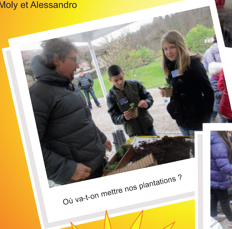
Où va-t-on mettre nos plantations ?