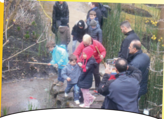
FÊTE DES ENFANTS