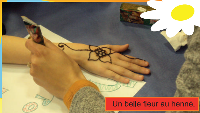
Un belle fleur au henné.

Les enfants du groupe St Vincent ont fait de la peinture sur verre avec un pochoir.