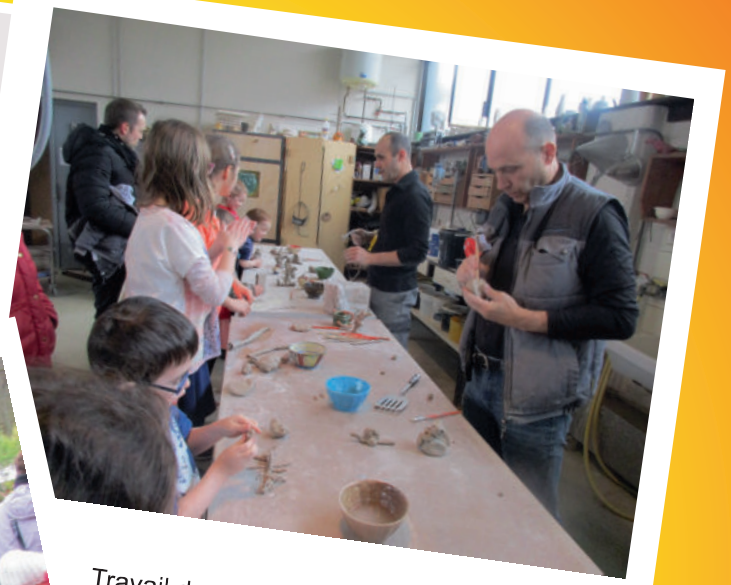
Travail de précision et d'attention à la poterie.