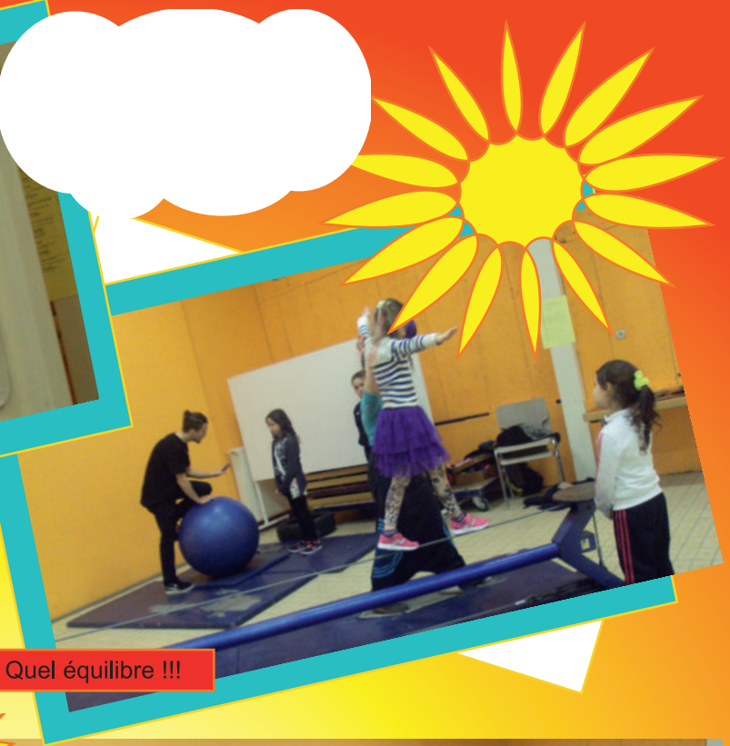
Quel équilibre !!!