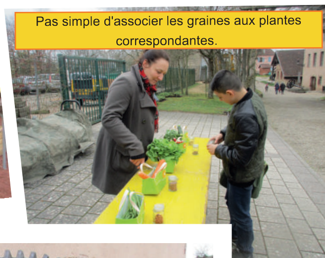
Pas simple d'associer les graines aux plantes correspondantes.