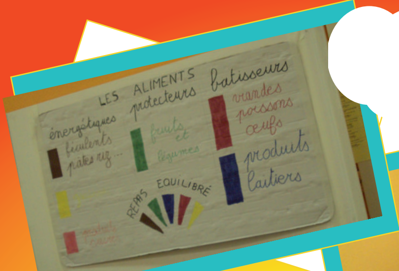
Tableau des aliments