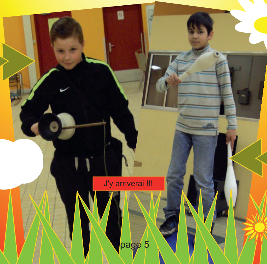
J'y arriverai !!!