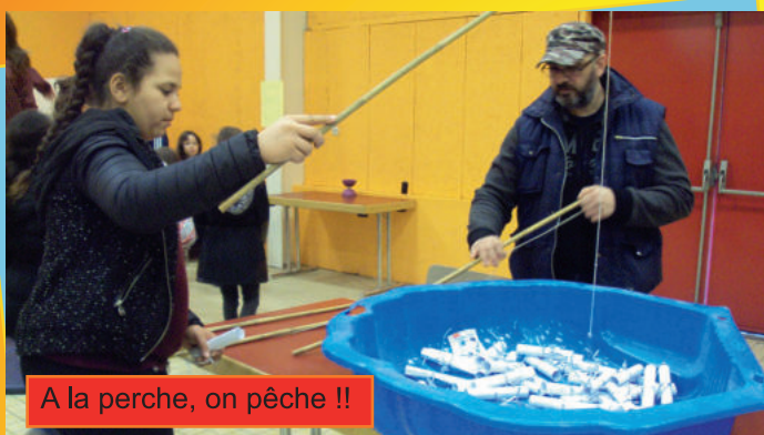
A la perche, on pêche !!

La Perche Soleil propose une petite pêche... de surprises, avec des dessins, des jeux à gagner.