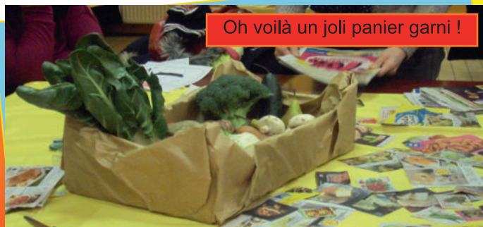
Oh voilà un joli panier garni !

Il fallait également estimer un panier garni de légumes et de fruits. Pour moi, il était à 10 euros, et justement, je l'ai gagné car il était à 10,91 euros.