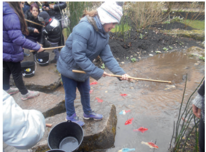
Ça mord ?