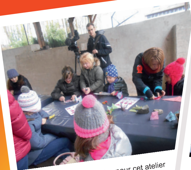
Un peu de concentration pour cet atelier d'origami