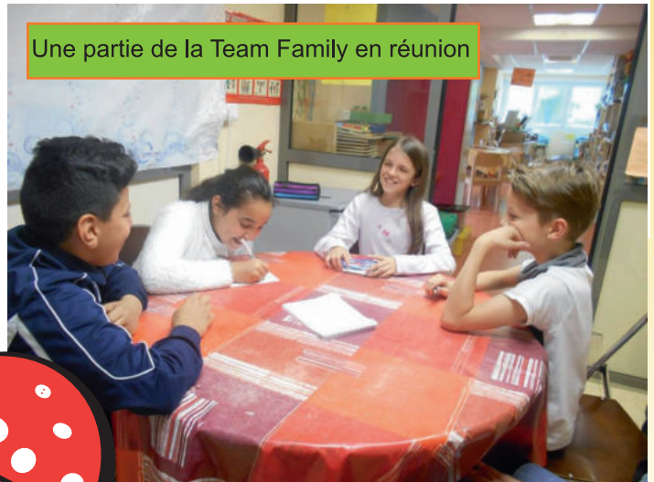
Une partie de la Team Family en réunion