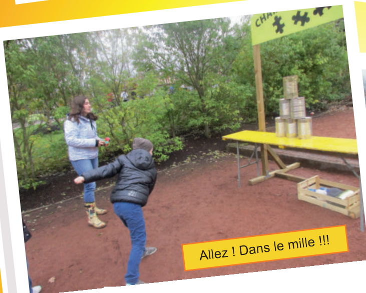
Allez ! Dans le mille !!!