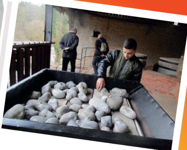
En voilà des galets !