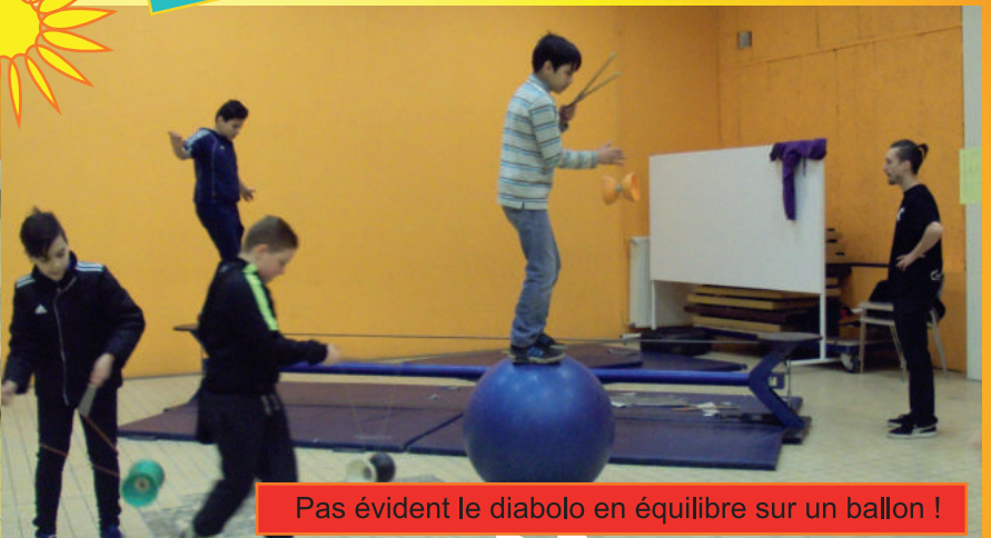
Pas évident le diabolo en équilibre sur un ballon !