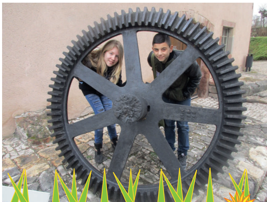
Nous voilà bien encadrés !